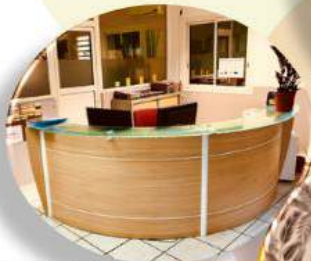
Accueil de nos bureaux